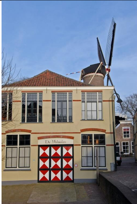
Links staat de Grote Volmolen

Vervolg de Veerstal richting het roodgekleurde Tolhuis. Houdt het Tolhuis aan uw linkerhand. Ga voorbij het Tolhuis even naar links de Oosthaven op en ga dan direct rechts de Punt op.