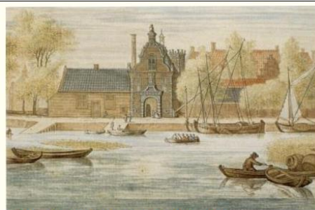
Links van de poort de Kleine Volmolen (Veerstal)

Aan het einde van de Peperstraat (links) heeft “De Kleine Volmolen” gestaan. Deze is gebouwd in 1620 om wol te “vullen”, een onderdeel van de lakenindustrie, waarbij wordt gebeukt op vochtig laken om het weefsel een vastere structuur te geven. Voor die tijd werd dit door mensen (voeten) gedaan. Al in 1414 was er een duiker door de IJsseldijk gegraven die uitkwam op de gracht van de Peperstraat. Boven deze duiker werd “De Kleine Volmolen” in gebruik genomen.