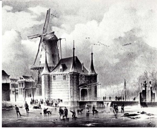
Molen de Noord (2) achter de Kleiwegspoort, anno 1840 door Gijsbertus Johannes Versluis Prent uit 1840

Op deze plek werd later (in ieder geval voor 1832) een stenen stellingmolen gebouwd, Molen De Noord (2), eveneens een korenmolen. Deze molen is in 1863 afgebroken. Aan de ronde vormen van de huidige bebouwing rechts op de hoek Kleiweg / Regentesseplantsoen is de vorm van de oude molen nog te herkennen.