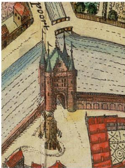
fragment kaart Joh. Blaeu, 1652

Loop het station uit aan de CENTRUM kant. Volg de bordjes "CENTRUM" en loop via de Vredebest naar het Kleiwegplein. Steek het plein en de Kleiwegbrug over.